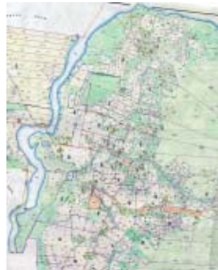
Laga skifte 1852