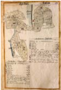
Geom. jordebok 1644 (Åsteby, Vitsand socken.)